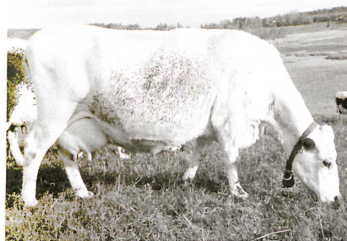
79 Donna, mor till 1057 Faramir.

Vi beslöt att förorda inköp av en tjurkalv efter 57 Filur – 2000 Maraton – 6774 Midar från just Linda och Thomas besättning. Modern är en fantastiskt snäll och trevlig ko från en gammal jämtlandslinje och vi hade ett kalverbjudande efter henne under fjolåret, men då tyckte vi hon var nog så ung och behövde visa framfötterna mer för att bli tjurmoder på Viking. De förhoppningar vi ändå hade har hon nu infriat och därför var det roligt att på ort och ställe få se både mor och son och då blev beslutet lätt att ta.