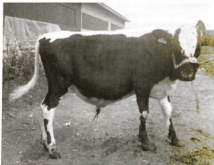
1057 Faramir, e: 57 Filur.

Det blir nästan snudd på orgiastiskt att åka ut på en fjällkosväg och själv såg jag på 5 dagar 300 fjällkor i 9 besättningar vilket gav ett saligt leende som räckte länge när jag väl var hemma igen. Bortsett från exteriörproblematiken som vi diskuterade och som är refererat på annat ställe i tidningen så hade vi för ovanlighetens skull ett flertal intressanta kalverbjudanden att ta ställning till för inköp till Viking Genetics.